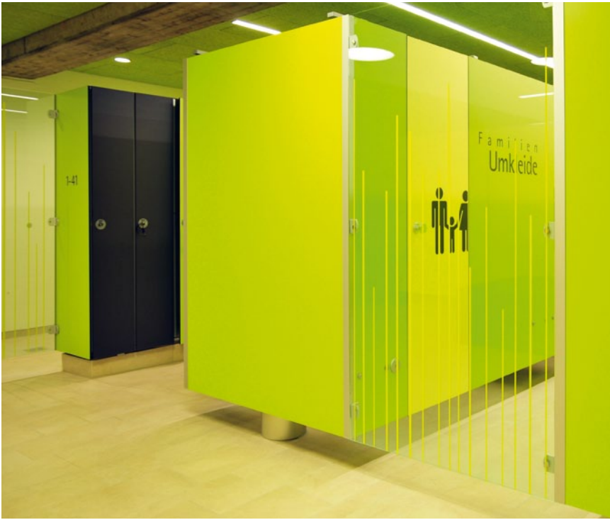
Deutlich erkennbar: Die Grundkonstruktion ruht auf einem zentralen Mittelfuß, der es ermöglicht, die Umkleiden ohne herkömmliche Trennwandfüße zu gestalten.