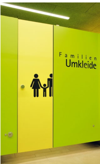
Neben Einzel- und Sammelumkleidekabinen stehen Familien auch separate Umkleidekabinen zur Verfügung

Bei dem hier eingesetzten Trennwandtyp S36 FLY sind die statisch notwendigen Füße in der Zwischenwand um 15 cm zurückversetzt. Dadurch entsteht beim Betrachten der schwebende Eindruck. Das zur Stabilisierung notwendige Kopfprofil in Edelstahl oder Alu ist um 10 cm zur Vorderfront nach hinten versetzt und somit in der Frontansicht nicht erkennbar. Die Wand- und Trennwandanschlüsse werden als Schattenfuge ausgebildet. Der Anschluss an die Vorderwand erfolgt unsichtbar ohne Profile durch einen Bettladeneinhängerverschluss.