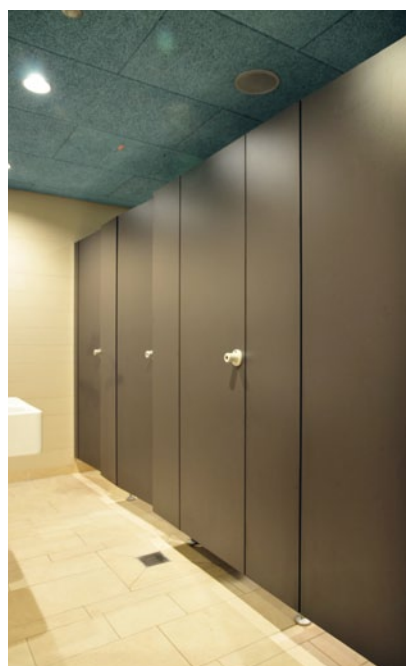
Statisch notwendige Füße der Trennwandanlage S36 FLY sind zurückversetzt und lassen die Wände „schweben“